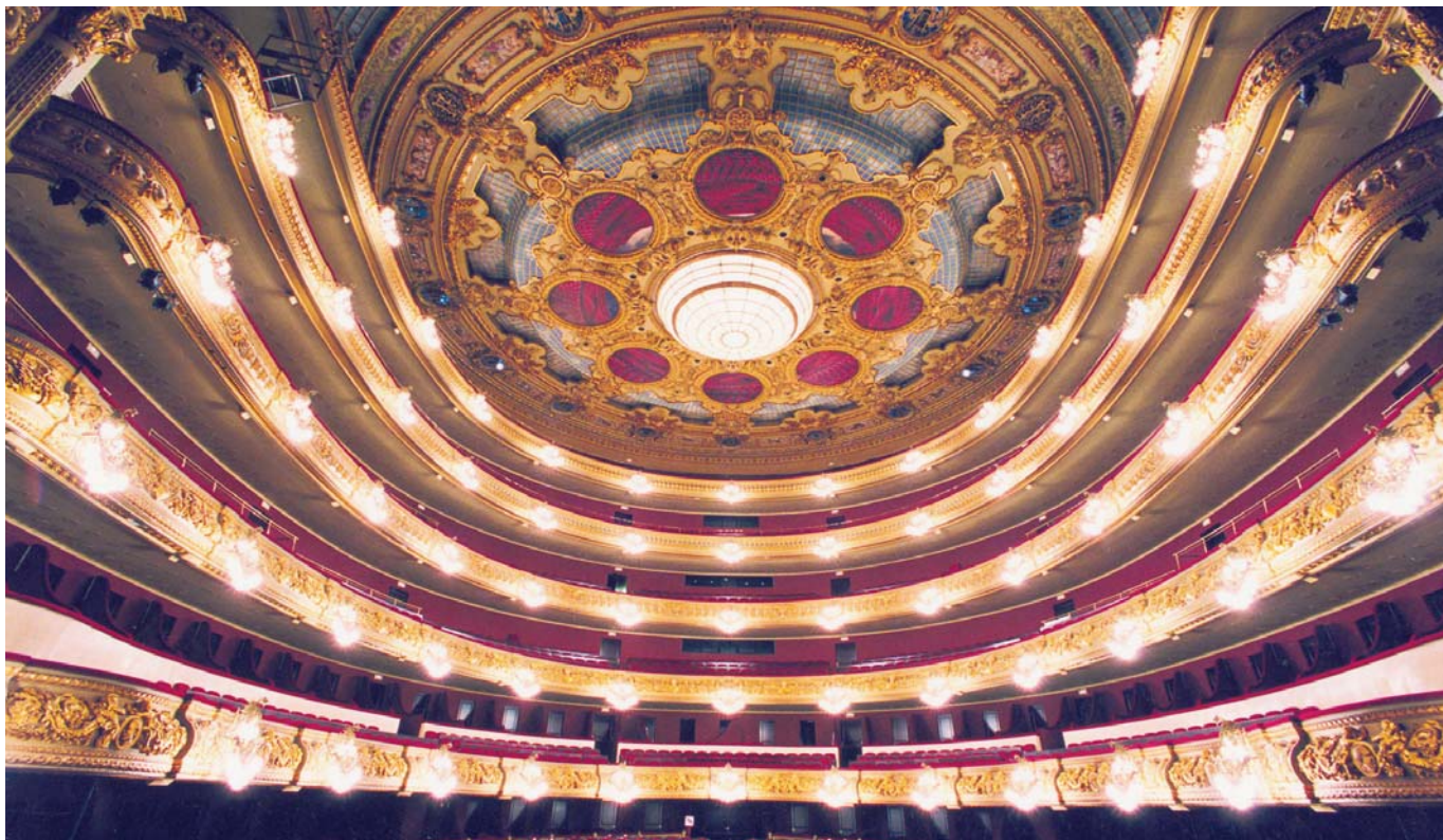
Gran Teatre del Liceo