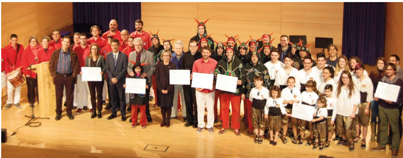
Ceremonia de entrega de reconocimientos a los representantes de los elementos elegidos como 7 Tesoros del Patrimonio Cultural del Vendrell, celebrada el día 14 de Enero de 2017