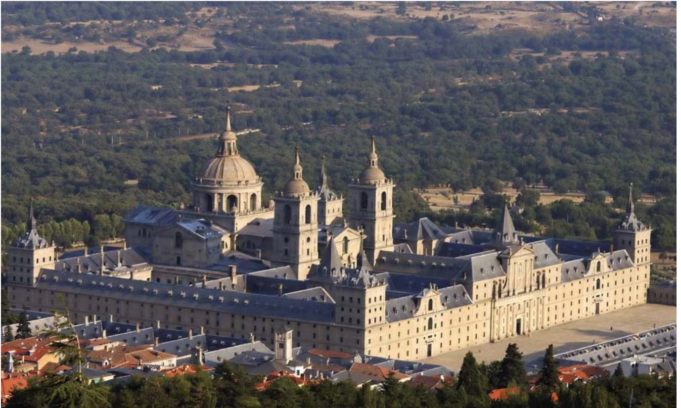
Monasterio y Real Sitio de San Lorenzo del Escorial