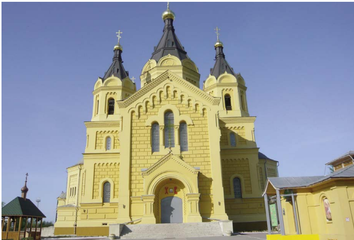
Catedral de San Alejandro del Neva