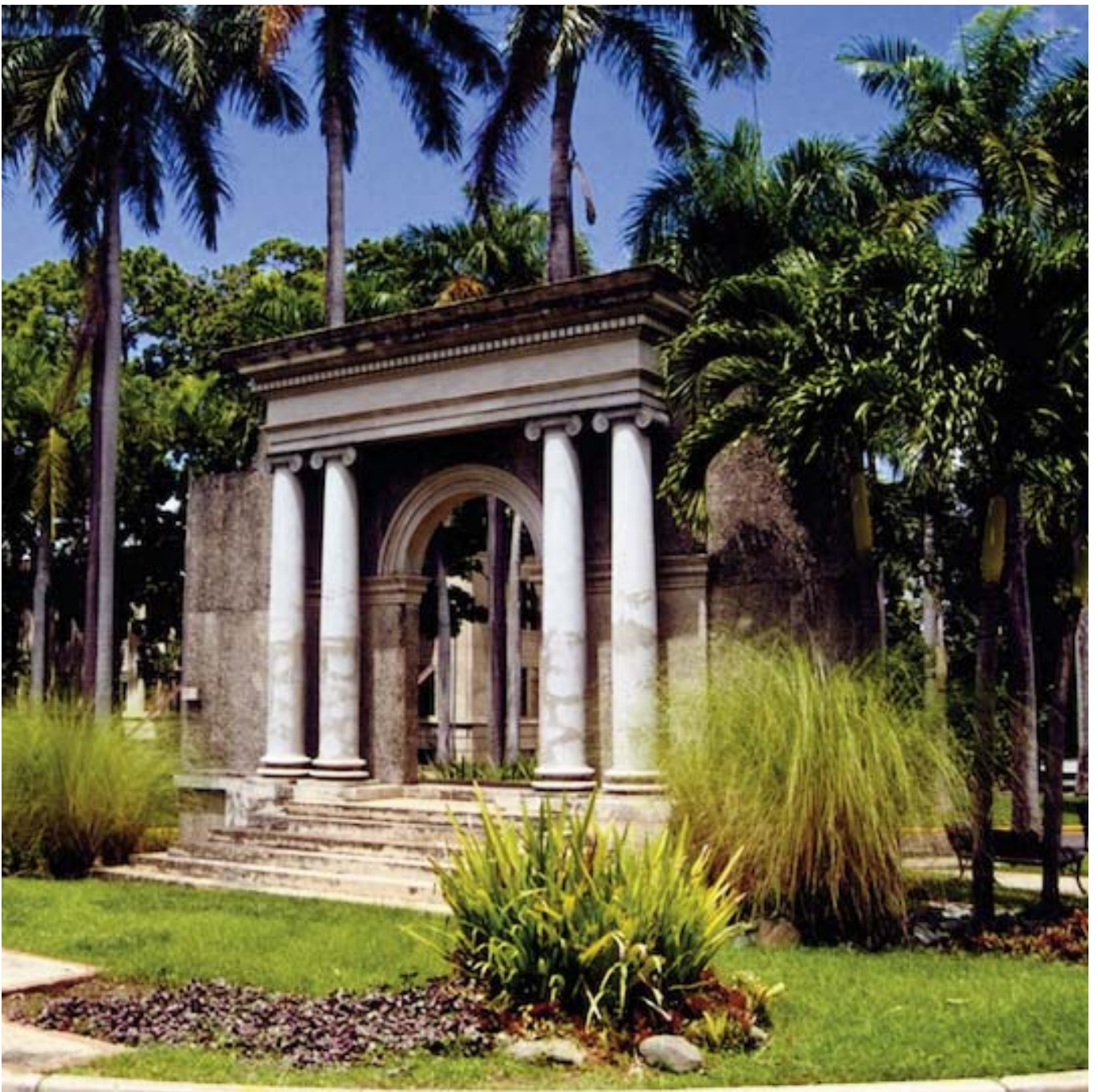
Pórtico histórico del Recinto Universitario de Mayagüez

En 1918 un terremoto destruyó parcialmente la ciudad de Mayagüez y un fuego causaron daños significativos a la institución universitaria. Las ruinas de la entrada de uno de los edificios que resistió la devastación pasaría luego a convertirse en el emblema de la institución. En 1988 estas ruinas (El Pórtico) fueron recreadas en un monumento.