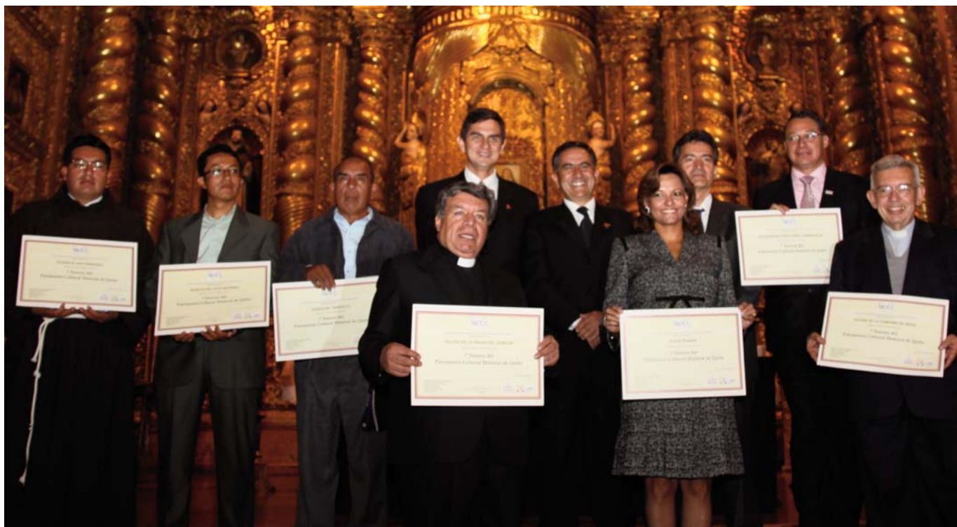
Augusto Barrera, Alcalde del Distrito Metropolitano de Quito, y Xavier Tudela, Presidente del Bureau Internacional de Capitales Culturales, con los representantes de los elementos elegidos Tesoros del Patrimonio Cultural de Quito. La ceremonia se celebró en la Iglesia de la Compañía de Jesús