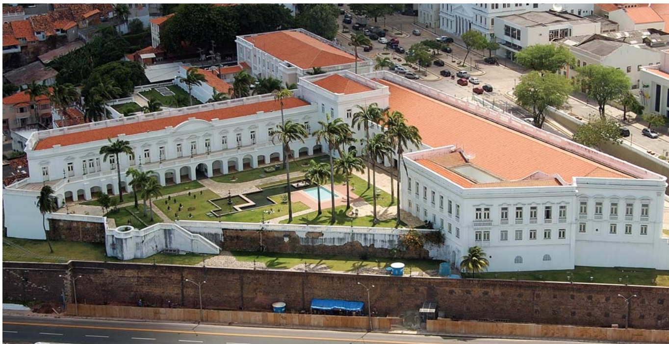
Palacio de los Leones