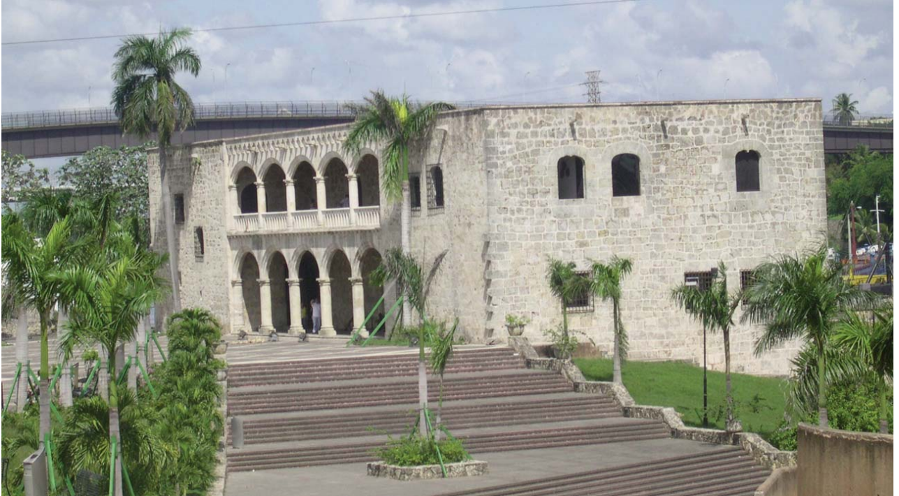
Alcázar de Colón