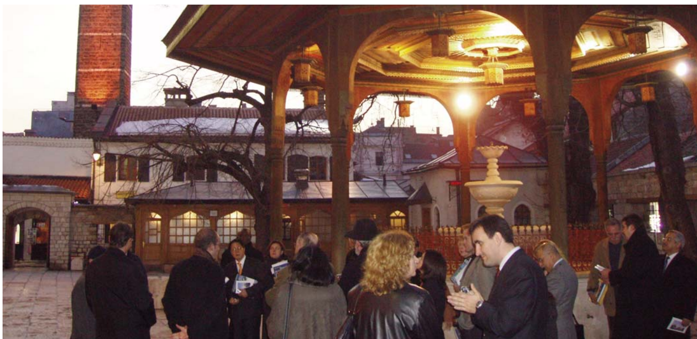
Barrio antiguo de Sarajevo (Bascarsija)