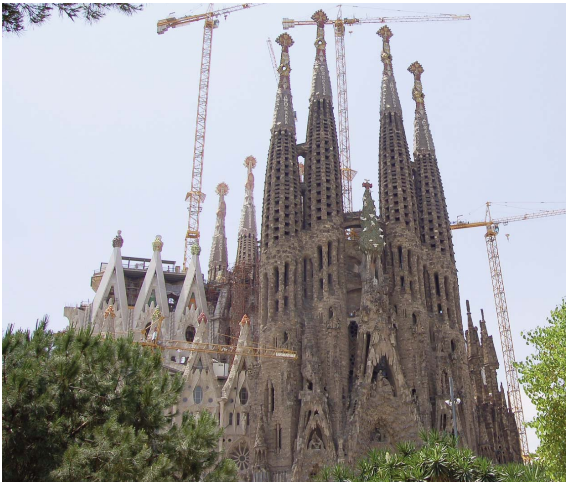
Templo Expiatorio de la Sagrada Familia de Barcelona