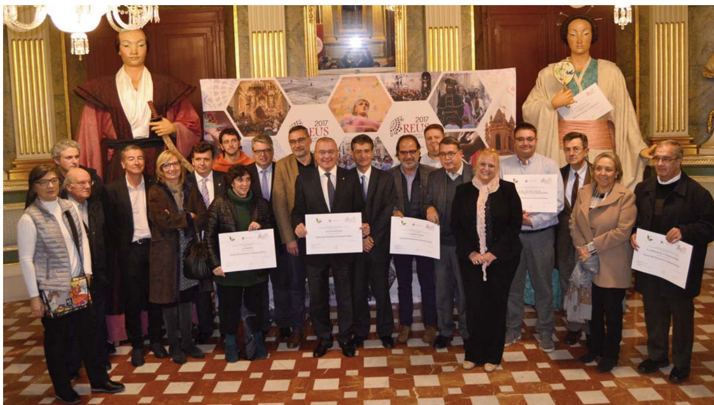
Ceremonia de entrega de los diplomas acreditativos a los representantes de los elementos elegidos como Tesoro del Patrimonio Cultural de Reus, celebrada en el Palacio Bofarull el día 13 de Diciembre de 2016