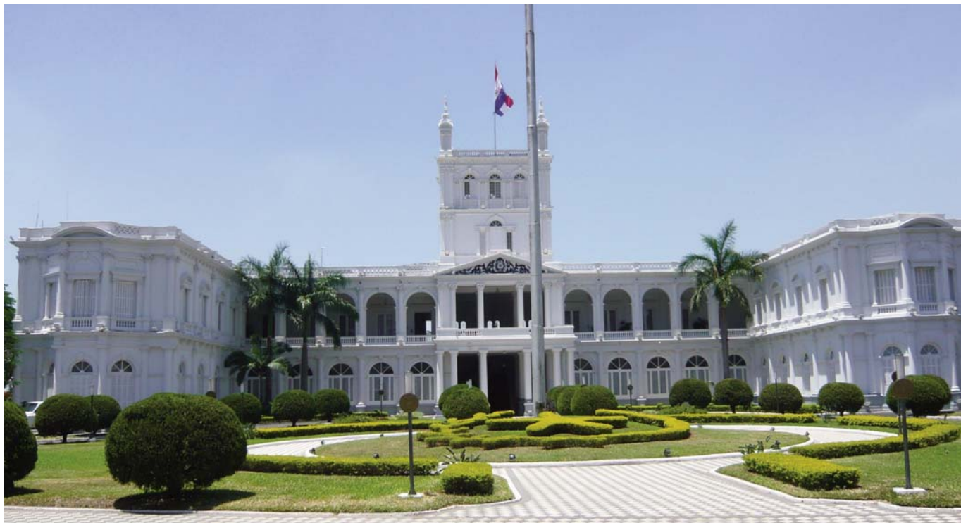
Palacio de los López