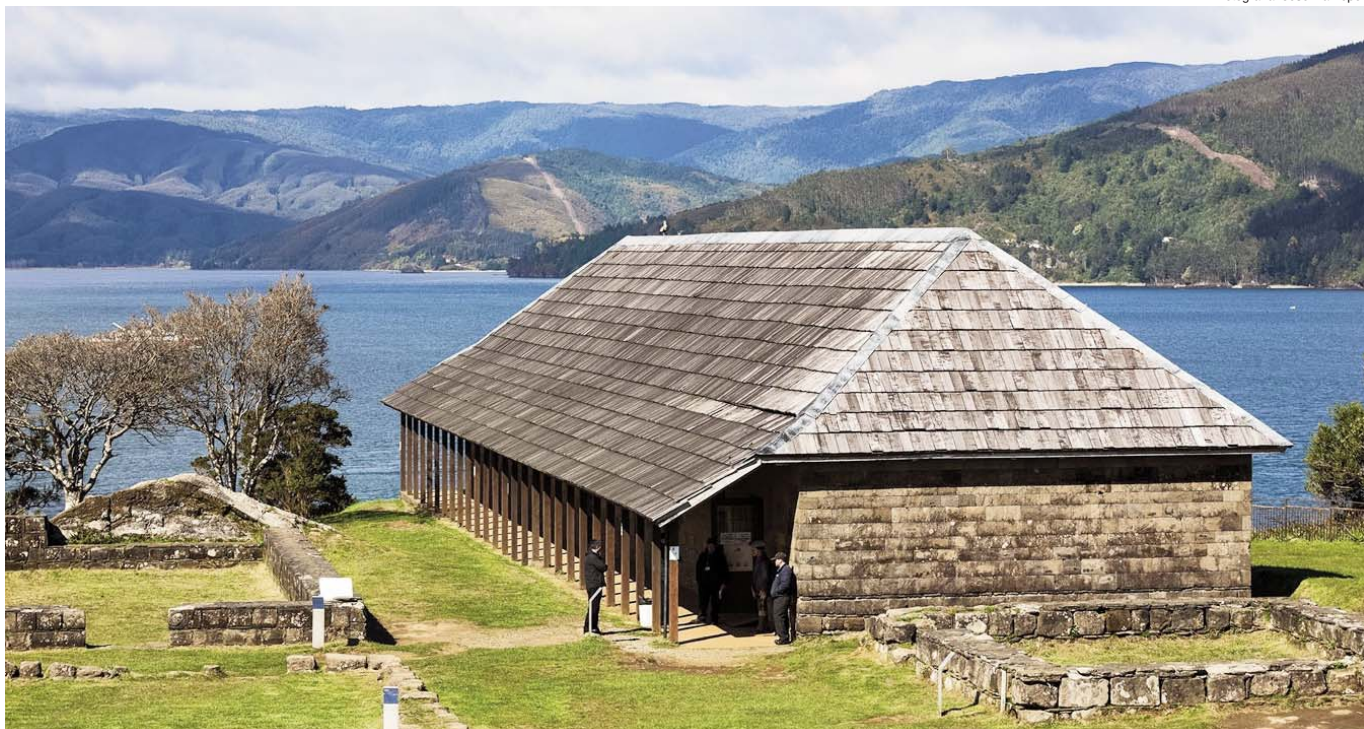
Fuerte de Niebla