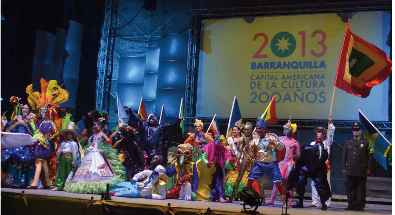
Carnaval de Barranquilla