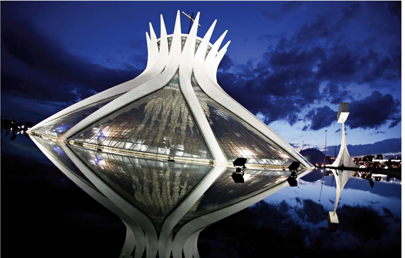
Catedral de Brasilia