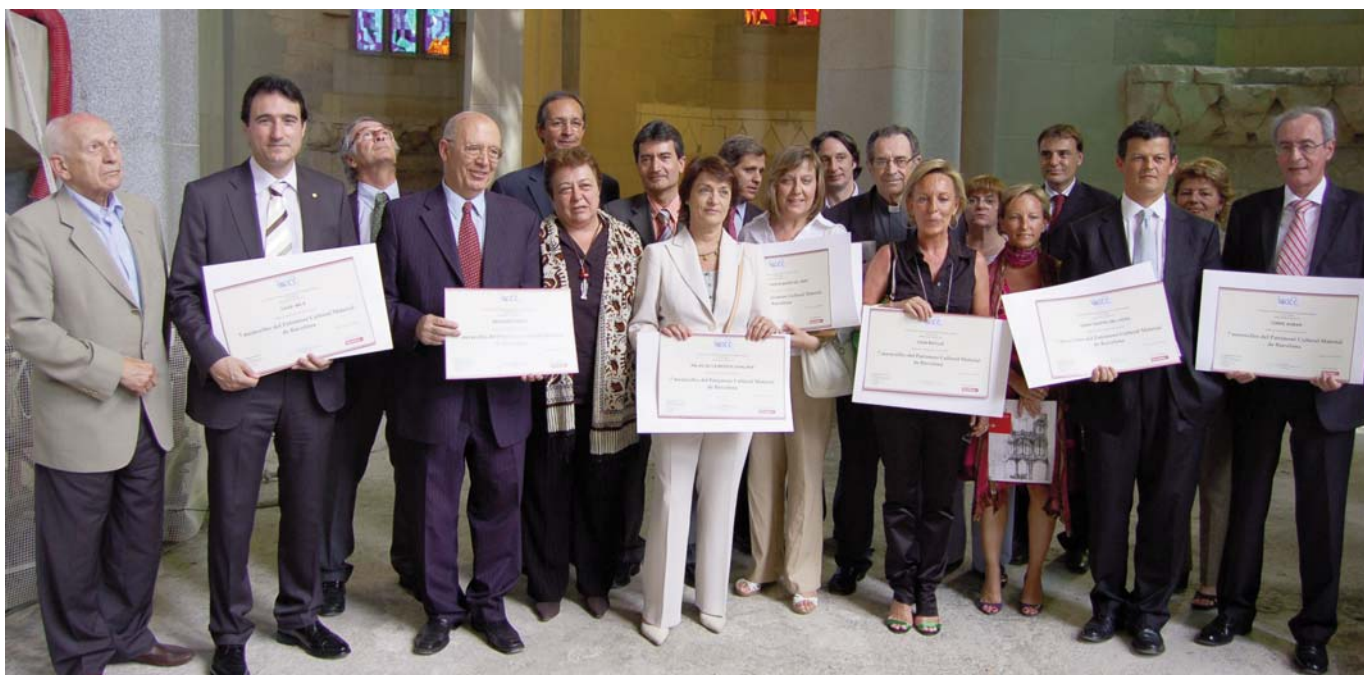
Ceremonia de entrega de los diplomas a los representantes de los tesoros de Barcelona, acto celebrado en el interior del Templo Expiatorio de la Sagrada Familia, en presencia del actual alcalde de Barcelona, Xavier Trias, y varios concejales del Ayuntamiento de Barcelona