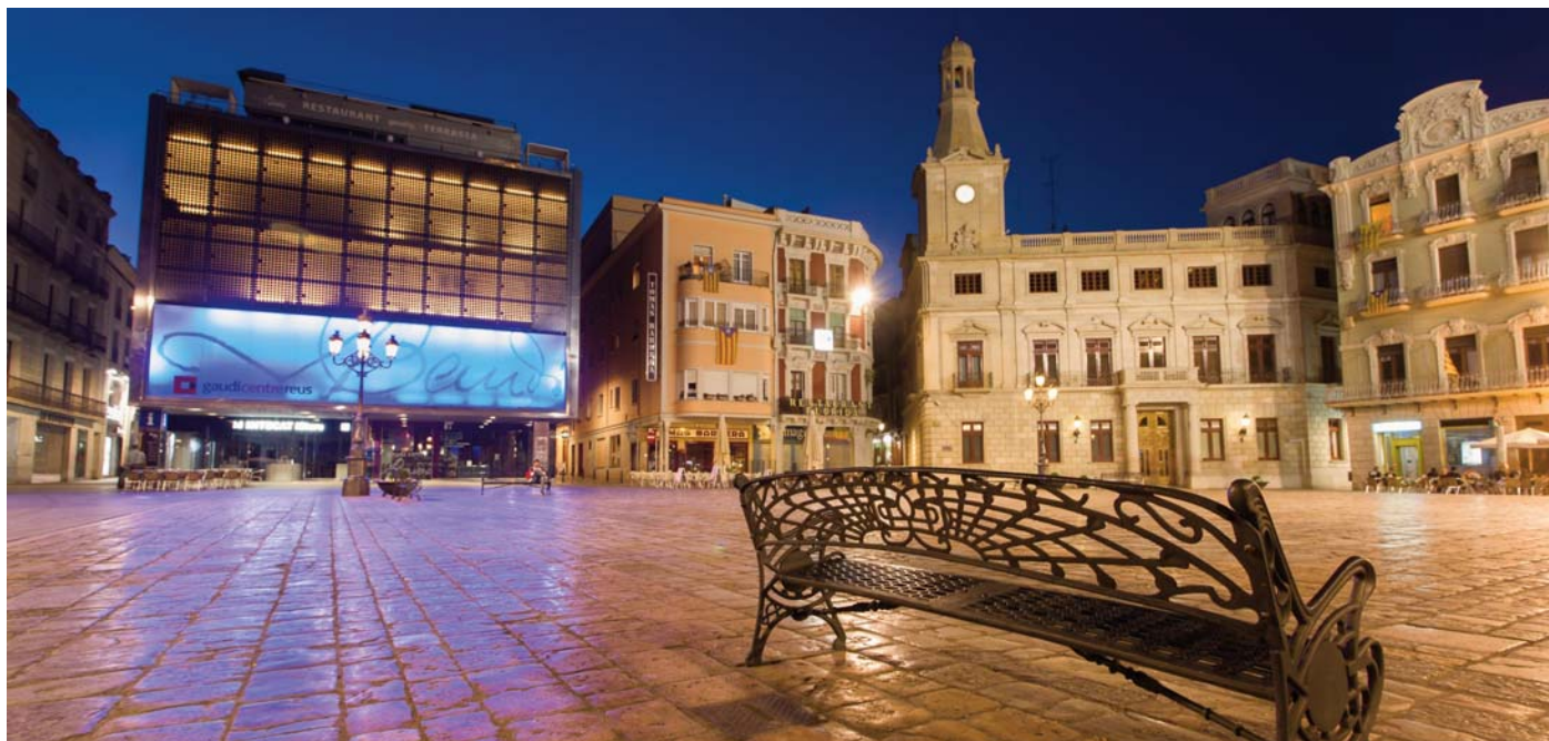
Plaza del Mercadal