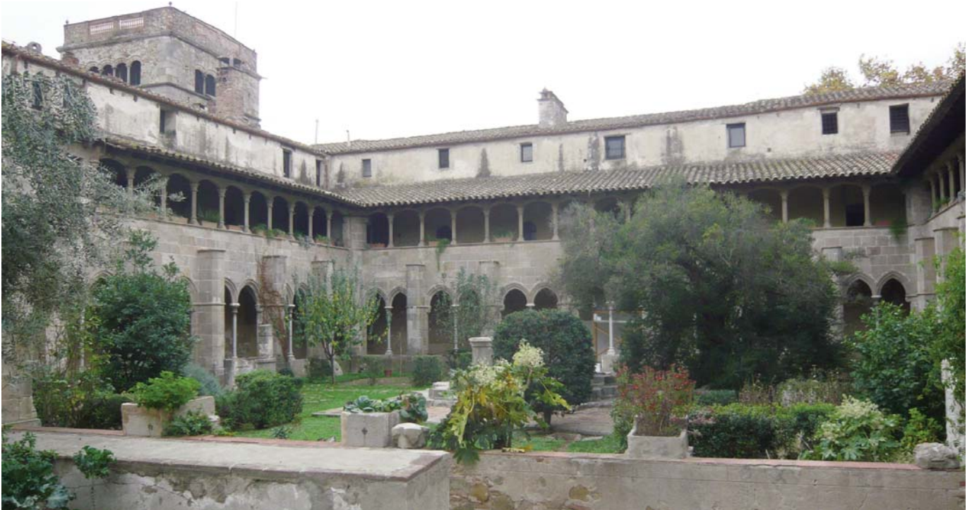
Monasterio de Sant Jeroni de la Murtra