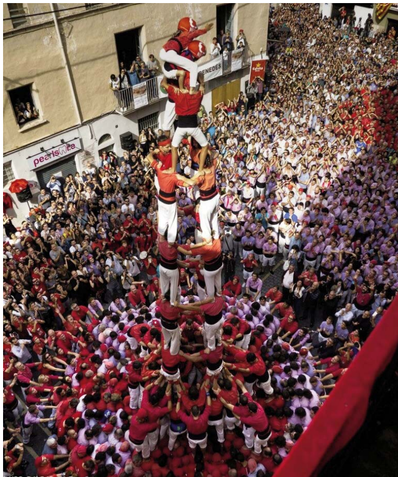
Niños del Vendrell