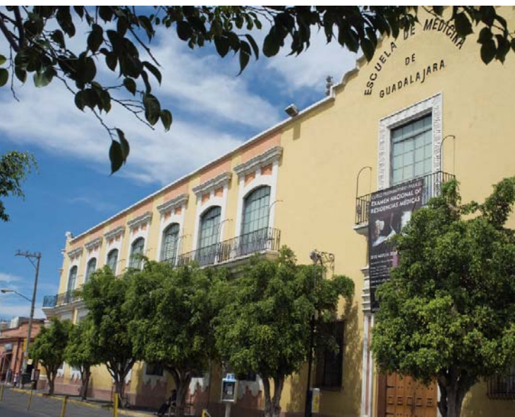
Antigua Facultad de Medicina