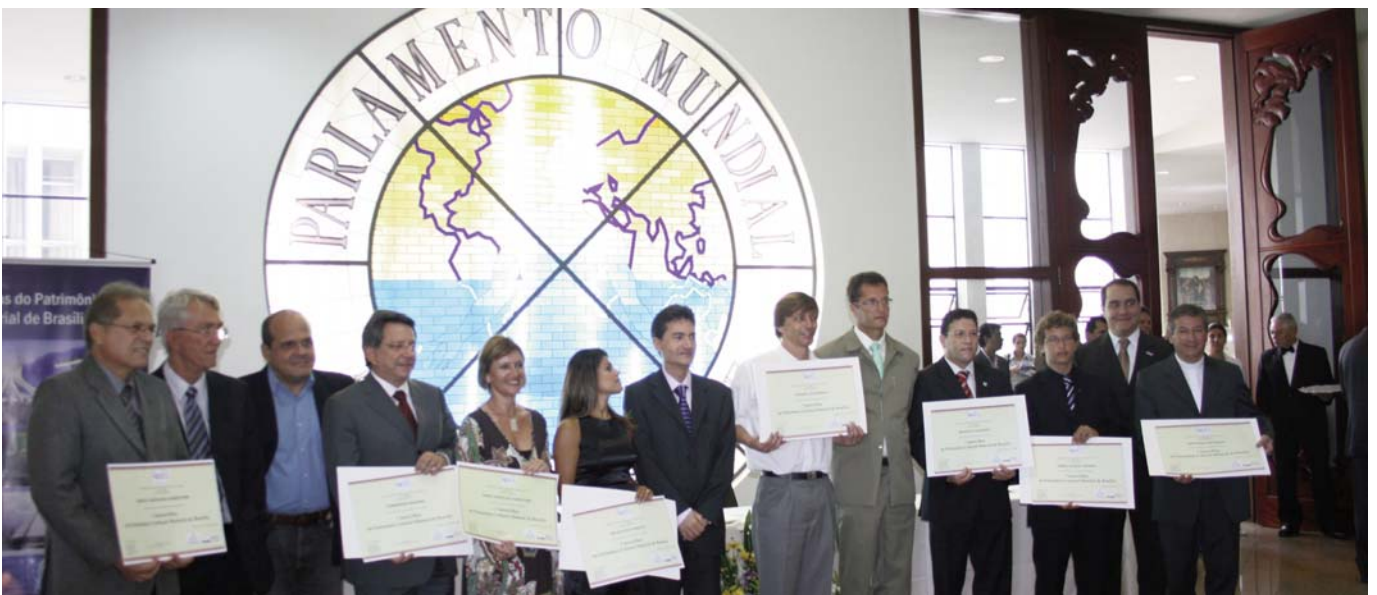
Ceremonia de entrega de los diplomas a los representantes de los tesoros de Brasilia, celebrada en el Templo de Boa Vontade, en presencia de Silvestre Gorgulho, Secretario de Estado de Cultura del Distrito Federal, y diputados y senadores federales de Brasil