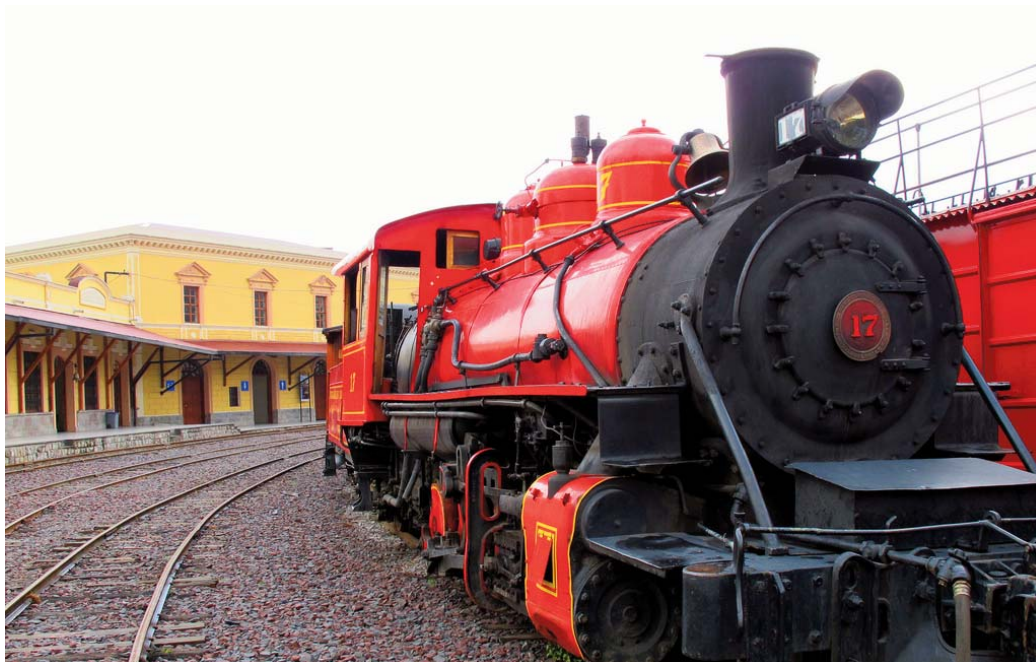
Estación de Ferrocarril Eloy Alfaro