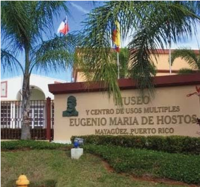
Museo Eugenio María de Hostos