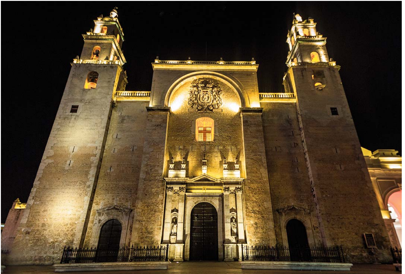
Catedral de Mérida