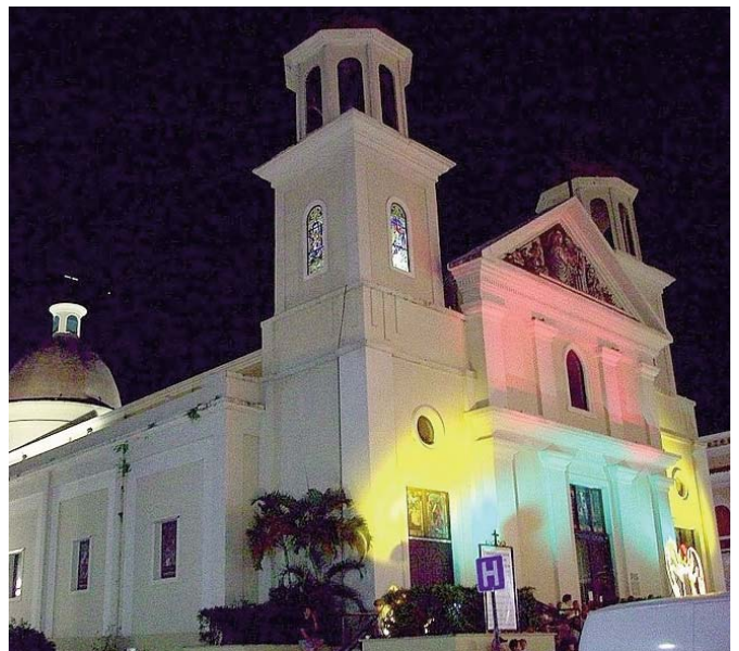
Catedral Nuestra Señora de la Candelaria