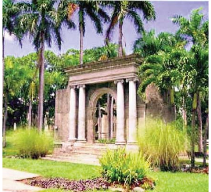
Pórtico del Recinto Universitario de Mayagüez