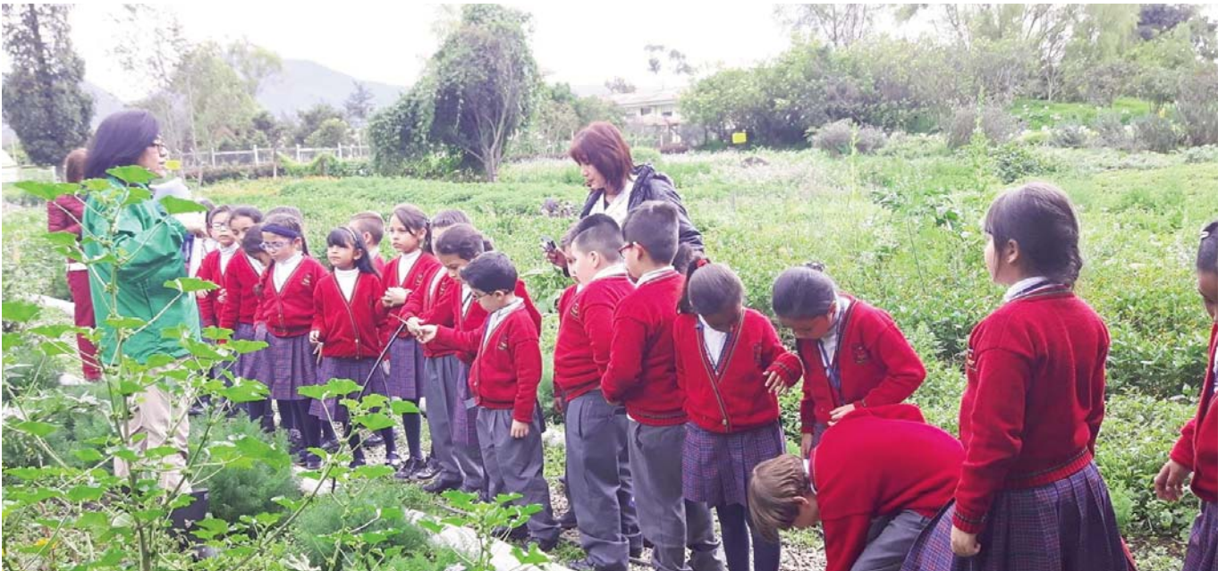
Jardín Medicinal Jorge Piñeros Corpas

La Fundación Universitaria Juan N. Corpas cuenta en su campus con un terreno de nueve mil m 2 donde se encuentra el Jardín Medicinal Jorge Piñeros Corpas, cultivo orgánico certificado, bautizado en homenaje a la obra del fundador y a su preocupación por investigar y aprovechar los recursos naturales del país y las bondades de la flora medicinal colombiana, con criterio de sostenibilidad y beneficio social. El jardín, que forma parte de una Reserva Forestal Ambiental, alberga un ecosistema conformado por diferentes especies de mariposas, aves, mamíferos pequeños y anfibios que prestan servicios ambientales de gran importancia tales como control biológico de plagas, polinización y dispersión de semillas. Para la Fundación Universitaria es este un escenario único para contribuir al desarrollo de la conciencia ecológica y de sostenibilidad ambiental en escolares, universitarios y la comunidad en general.