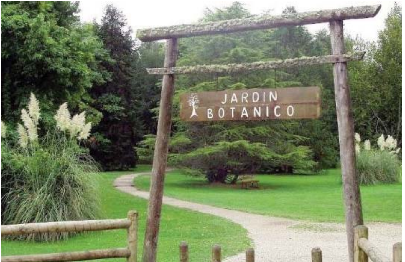
Jardín Botánico de la Universidad Austral de Chile en Valdivia

Actualmente el Jardín se encuentra en una etapa de modernización que tiene por objetivo transformarlo en un centro de investigación, educación y cultura.