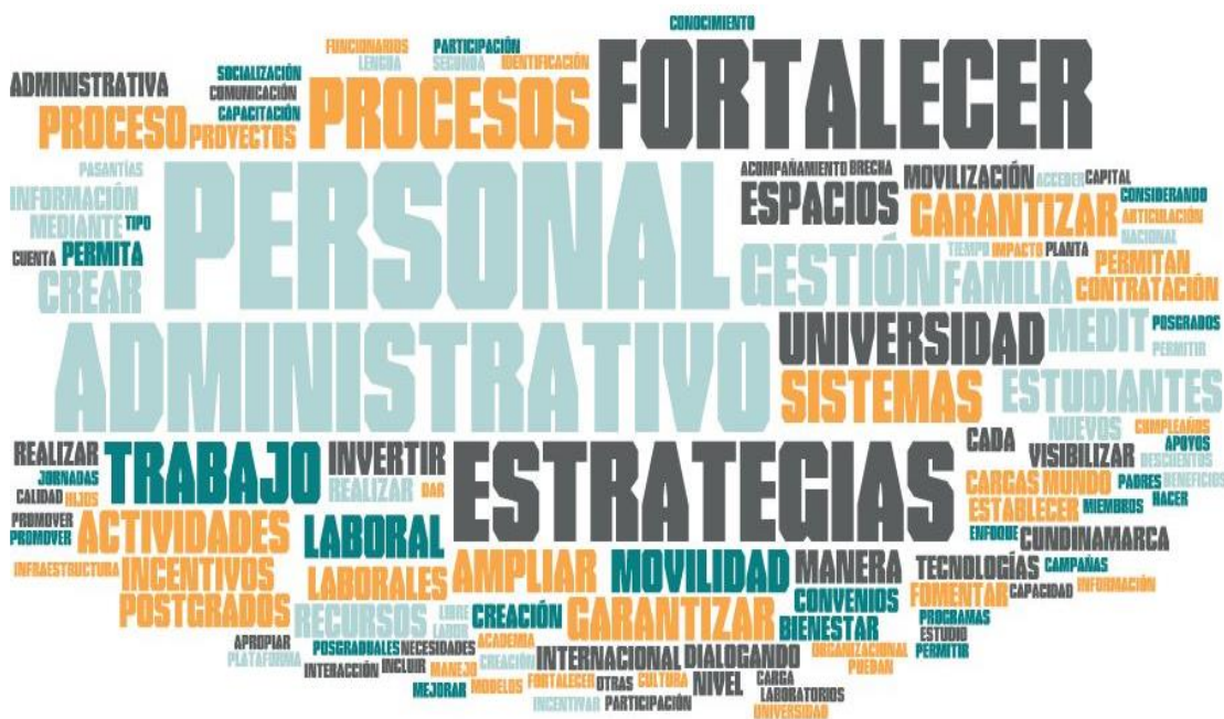
Figura 1 Nube de palabras

En conjunto, estas herramientas de análisis exploratorio constituyen un punto de partida sólido y completo para comprender la naturaleza y el alcance de los temas abordados, proporcionando una base sólida para investigaciones posteriores y análisis más profundos.