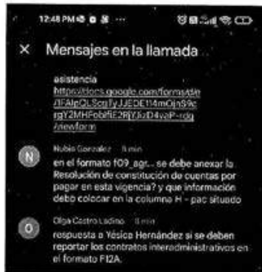
Ilustración 2 Captura de Pantalla – Respuesta capacitación SIA Contralorías