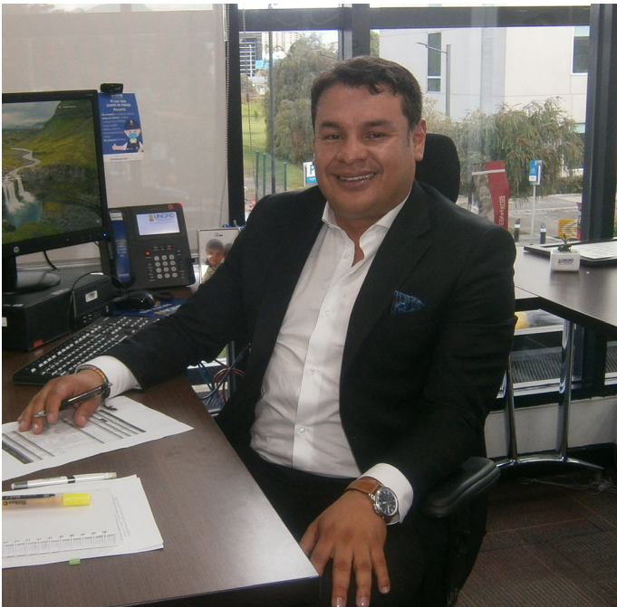
Ingeniero agrónomo monitorea los riesgos de desastres en el país | Pag. 4