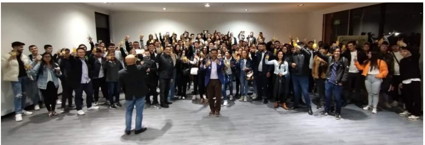
Oficina de graduados socializó portafolio de servicios a los futuros profesionales | Pag. 5

Síguenos en nuestras redes sociales oficiales