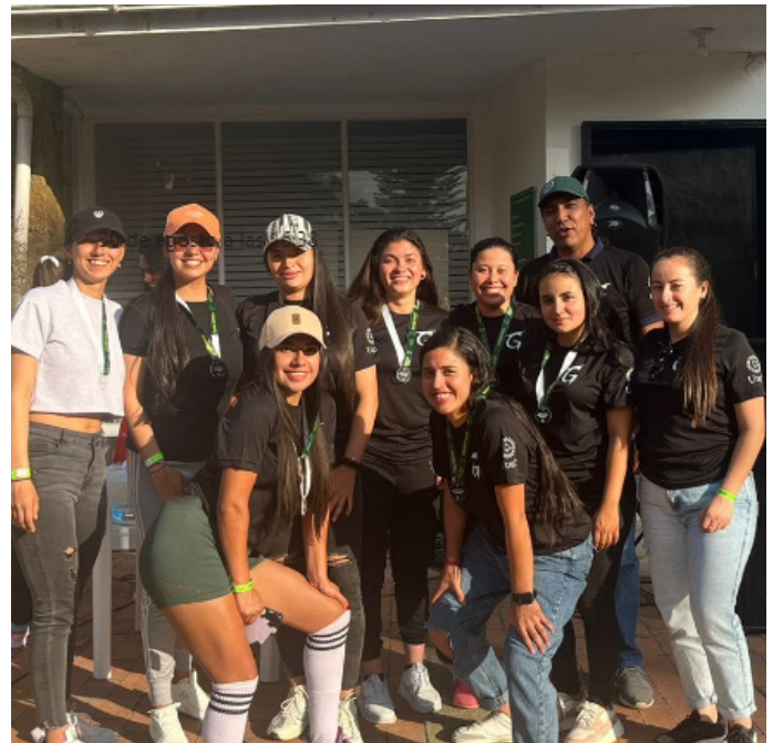
Así fue el V Encuentro de Graduados UCundinamarca | Pag. 6