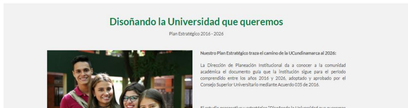
Imagen No. 3: https://www.ucundinamarca.edu.co/index.php/plan-estrategico-2016-2026

Página web institucional: En Cumplimiento a la ley 1712 de 2014 específicamente el botón del “ Ley de Transparencia y derecho de acceso a la información pública ”, la Universidad de Cundinamarca atiende en su mayoría a los requerimientos exigidos para la transparencia activa y la transparencia pasiva. Igualmente, en la web institucional, se encuentra otro botón denominado ley 1474 de 2011 donde se atiende información relacionada con el control de la gestión pública que incluye seguimientos a la ejecución presupuestal por vigencias, estados financieros, entre otros.