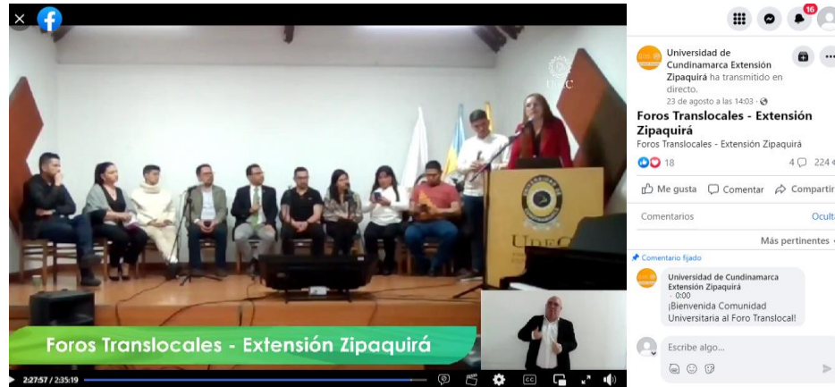
Imagen No. 10: “Transmisión en vivo Foro Translocal Extensión Zipaquirá”: https://www.facebook.com/UCundinamarcaZipaquirá/videos/1646443125880262