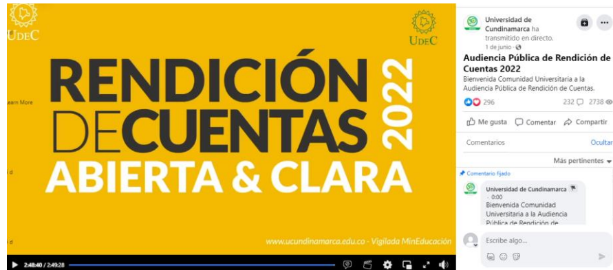
Imagen No.6: https://www.facebook.com/ucundinamarcaoficial/videos/1606502769762065

La Dirección de Planeación gestionó la publicación en el portal institucional de la Universidad de Cundinamarca, la información correspondiente a la realización de la Audiencia Pública de Rendición de Cuentas - Abierta y Clara Vigencia 2022, la cual contiene información relevante a las partes interesadas, como adicional a la información que reposa en este espacio de vigencias anteriores, se incluye link estrategia rendición de cuentas.