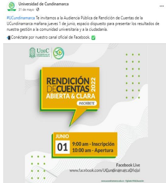
Imagen No. 8: https://www.facebook.com/ucundinamarcaoficial/

de Rendición de Cuentas: La Universidad de Cundinamarca con el fin de dar a conocer a la ciudadanía el ejercicio de rendición de cuentas, realizó las siguientes estrategias de comunicación: Correos masivos a estudiantes, docentes y administrativos, , periodistas, alcaldías y colegios del departamento, podcast para transmitir por la emisora UCundinamarca, boletín Interno y publicación en Intranet, divulgación en Redes Sociales ( Facebook, Instagram, Twitter, Fanpage unidades regionales ), microsítio en la Página web sobre Rendición de Cuentas, publicación del comunicado 002-V2 del 2022 cuyo asunto refirió “modificación fechas del plan de trabajo audiencia pública de rendición de cuentas UCundinamarca abierta y clara de la vigencia 2021” , boletín de Prensa a alcaldías y periodistas, la publicación de banner en la Página Web de la Institución.