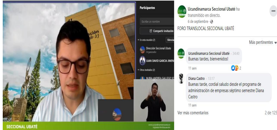
Imagen No. 12: “Publicación información Foro Translocal Seccional Ubaté”: https://www.facebook.com/UcundinamarcaSeccionalUbate/videos/859412632286581