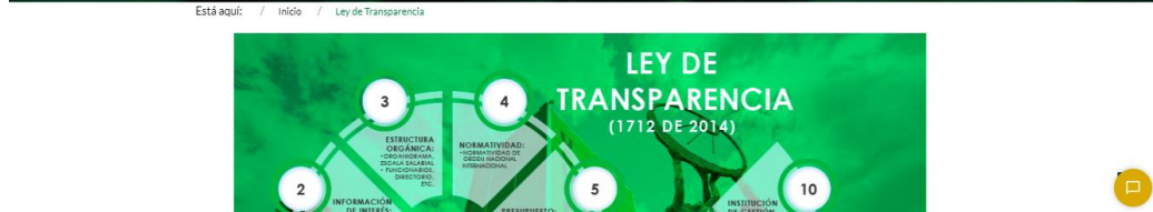
Imagen No. 4: https://www.ucundinamarca.edu.co/index.php/ley-de-transparencia

En esta misma línea en la página web se encuentran habilitados espacios de participación ciudadana, agente virtual, un banner inicial donde se realizan publicaciones constantes de noticias y eventos, gaceta normativa, una lista desplegable de opciones para consulta del usuario (sobre la u, pregrado, posgrado,