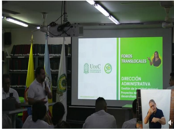
Foro Translocal Seccional Girardot