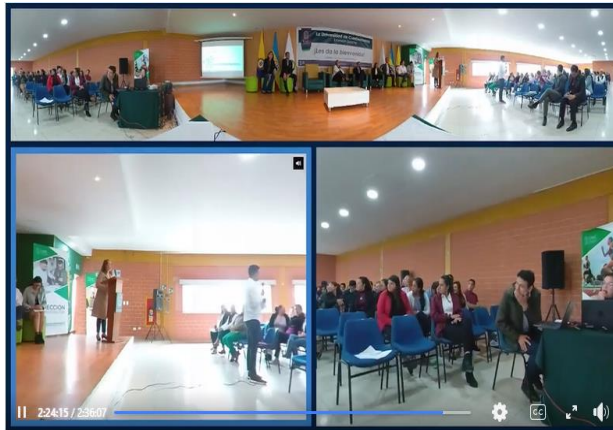
Foro Translocal de Gestión