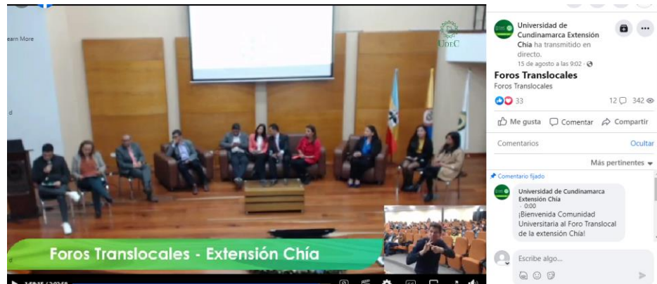
Imagen No. 11: “Publicación información Foro Translocal Extensión Chía”: https://www.facebook.com/UCundinamarcaChía/videos/943389650090053

Diagonal 18 No. 20-29 Fusagasugá – Cundinamarca Teléfono: (091) 8281483 Línea Gratuita: 018000180414 www.ucundinamarca.edu.co E-mail: info@ucundinamarca.edu.co NIT: 890.680.062-2