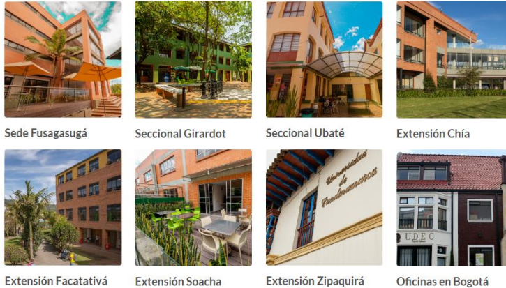
Imagen No. 5: https://www.ucundinamarca.edu.co/index.php/launiversidad/sedes https://www.ucundinamarca.edu.co/index.php/universidad/cobertura-departamental