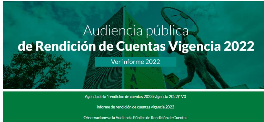
Imagen No. 1: https://www.ucundinamarca.edu.co/index.php/rendicion-de-cuentas

Publicación de planes, programas y proyectos: Como objetivo del proceso de fomentar una cultura de planeación mediante la gestión de planes, programas y proyectos que permitan apoyar la toma de decisiones estratégicas, el