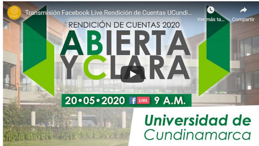
Imagen N° 1 https://www.ucundinamarca.edu.co/index.php/rendicion-de-cuentas

Publicación de planes, programas y proyectos: Como objetivo del proceso de fomentar una cultura de planeación mediante la gestión de planes, programas y proyectos que permitan apoyar la toma de decisiones estratégicas, el cumplimiento de la misión y el logro de la visión institucional, la oficina de planeación institucional puso disposición de la comunidad en general de los documentos estratégicos en la página web institucional www.ucundinamarca.edu.co . (Plan Rectoral, Plan Estratégico, Plan de Desarrollo, Plan Anticorrupción y Plan de acción Institucional)