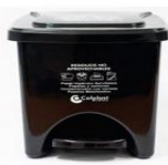
Papelera cuadrada 22L Negro