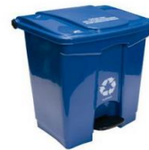
Papelera Pedal 60L