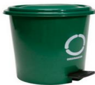
Papelera Pedal 12L