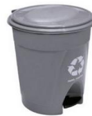
Papelera Pedal 25L