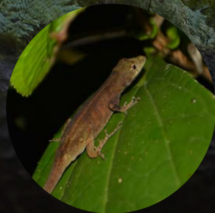
Foto 2. Anolis tolimensis