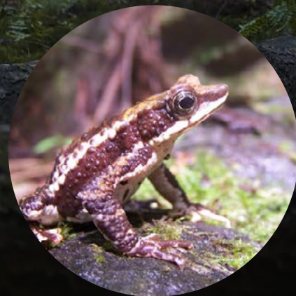
Foto 3. Atelopus laetissimus

La pérdida de la diversidad biológica es un hecho que se relaciona, entre otros factores, con la búsqueda del progreso económico del hombre y que ha alcanzado proporciones dramáticas (destrucción de bosques, calentamiento global y extinción de especies).