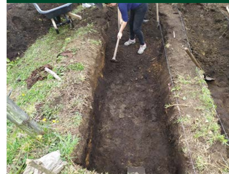
Apertura de lechos para proyectos de lombricultura