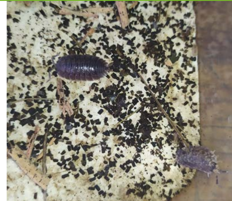
Cultivo de oniscídeos

Además, logramos generar dos capítulos del libro en el Encuentro Latinoamericano de Educación ELE 2020.