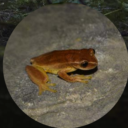
Foto 1. Dendrosophus padreluna