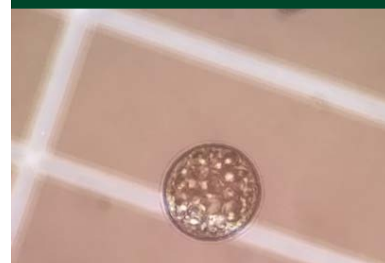
Identificación de microorganismos recolectados de la quebrada de Mancilla