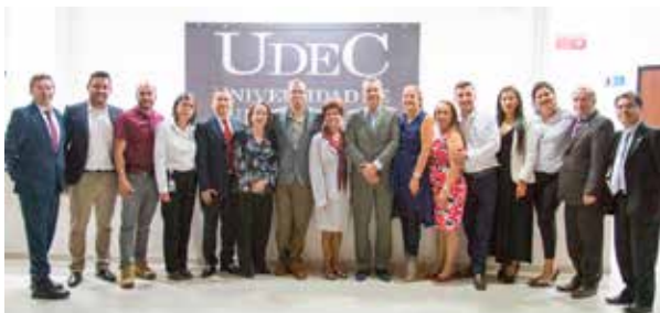
VISITA DE PARES ACADÉMICOS - PROG. ADM.