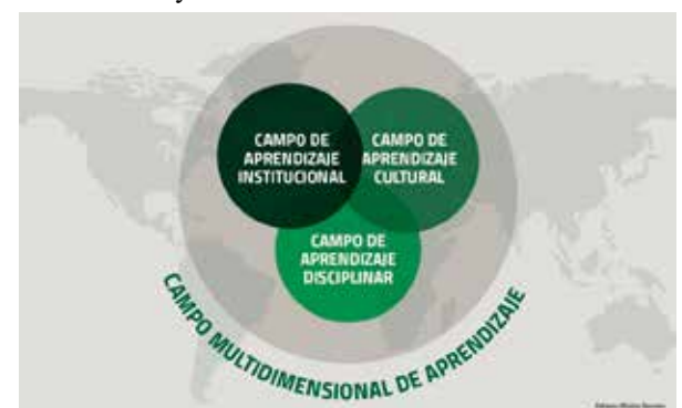
Figura 2. Campo multidimensional de aprendizaje.

La siguiente imagen presenta los ejes estructurales, las dimensiones y la finalidad del MEDIT.