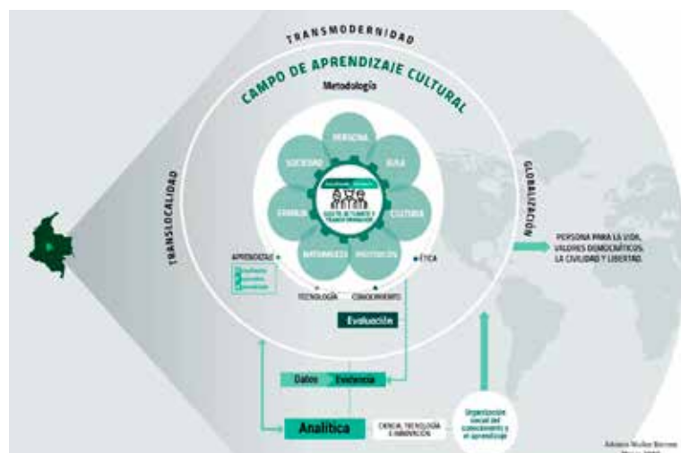
Figura 5. Campo de aprendizaje disciplinar.

cabó el trabajo colaborativo entre los estudiantes y el profesor.