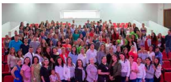
RECONOCIMIENTO MUJER SIGLO 21