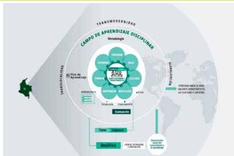
Figura 3. Campo de aprendizaje institucional.