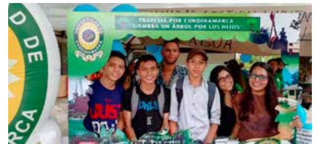
DÍA DEL AGUA UCUNDINAMARCA