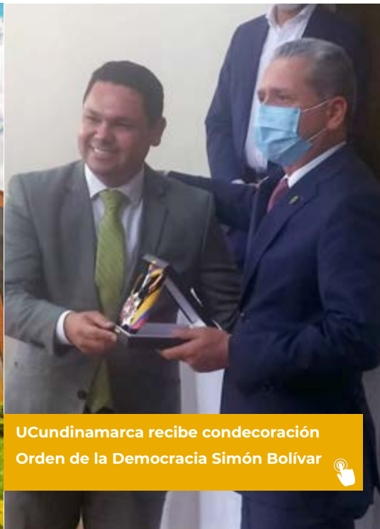
UCundinamarca recibe condecoración Orden de la Democracia Simón Bolívar