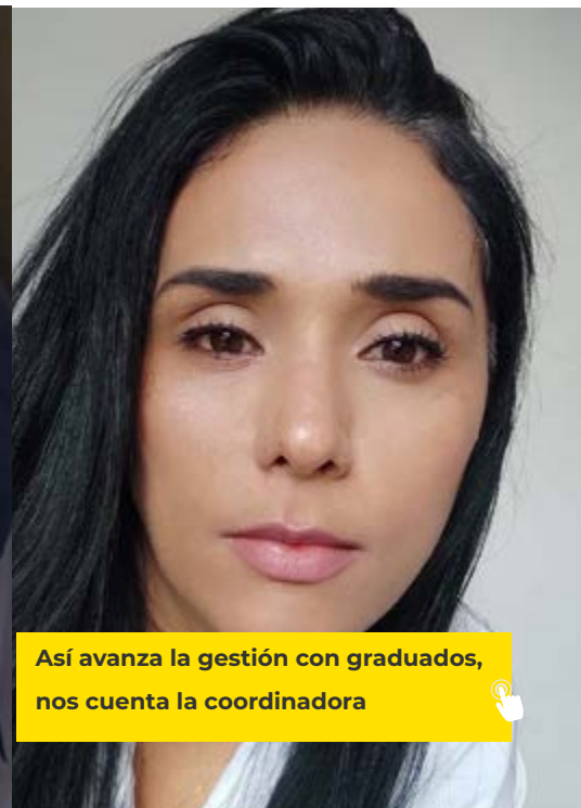
Así avanza la gestión con graduados, nos cuenta la coordinadora