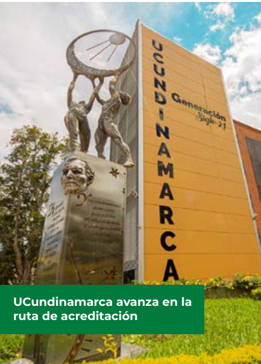
UCundinamarca avanza en la ruta de acreditación