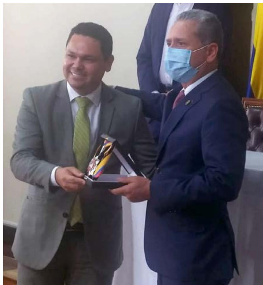
“El cocimiento y la educación deben ser bienes públicos y no comerciales en el siglo 21”, rector

“En la Universidad de Cundinamarca todo nuestro quehacer es público”, fueron las palabras del rector durante el acto de condecoración.