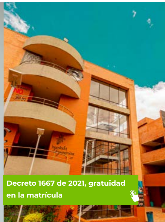
Decreto 1667 de 2021, gratuidad en la matrícula