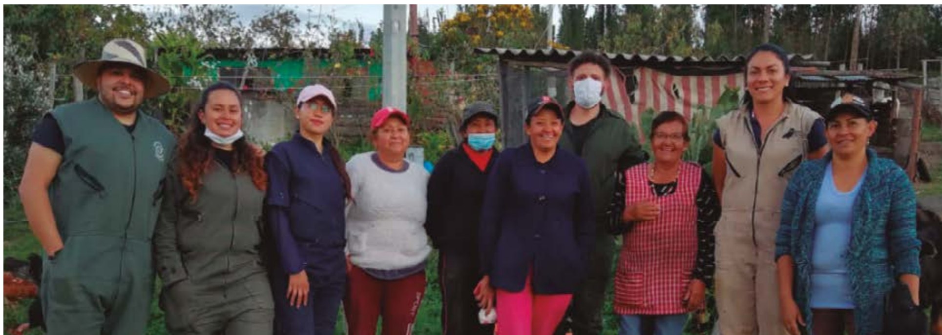
Imagen tomada de la Pagina Ubatenses que participan en las capacitaciones de lombricultivo

De esta forma la UCundinamarca trabaja en procesos de proyección social que benefician y mejoran las condiciones de vida de los entornos en donde la institución hace presencia.