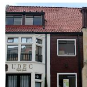
Oficinas en Bogotá

Imagen No. 5. https://www.ucundinamarca.edu.co/