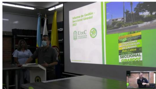
Imagen No. 14 “Transmisión en vivo Foro Translocal Extensión Girardot”: https://www.youtube.com/watch?v=ekTDvmQ_ATk