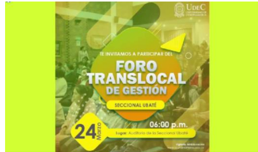
Imagen No. 13 “Transmisión en vivo Foro Translocal Extensión Ubaté”: https://www.facebook.com/ucundinamarcaoficial/videos/315747813956932