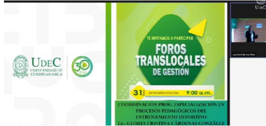
Imagen No. 8 “Transmisión en vivo Foro Translocal Extensión Soacha”: https://www.facebook.com/ucundinamarcaoficial/videos/4983667681679588