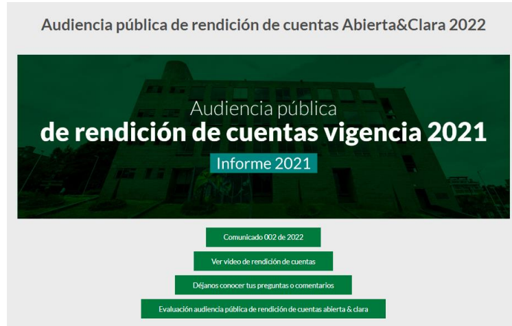
Imagen No. 1 https://www.ucundinamarca.edu.co/index.php/rendicion-de-cuentas