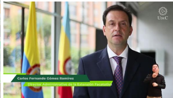
Imagen No. 11 “Publicación información Foro Translocal Extensión Facatativá”:

https://www.facebook.com/search/top/?q=Foro%20Translocal%20%23extensi%C3%B3nFacatativ%C3%A1