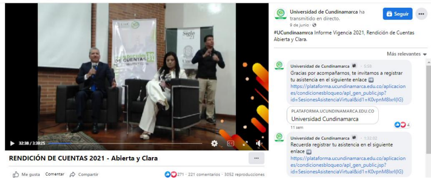
Imagen No. 5: https://www.facebook.com/ucundinamarcaoficial/videos/741166463573982

La Dirección de Planeación gestionó la publicación en el portal institucional de la Universidad de Cundinamarca, la información correspondiente a la realización de la Audiencia Pública de Rendición de Cuentas - Abierta y Clara Vigencia 2021, la cual contiene información relevante a las partes interesadas, como adicional a la información que reposa en este espacio de vigencias anteriores, se incluye link estrategia rendición de cuentas y allí se dispone documento sobre la estrategia aplicada en la vigencia 2022 para lo sucedido durante la vigencia 2021.