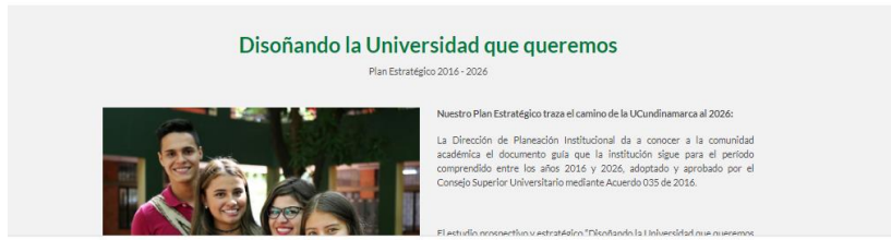
Imagen No 3: https://www.ucundinamarca.edu.co/index.php/plan-estrategico-2016-2026

Está aquí: / Inicio / Plan Estratégico 2016 - 2026