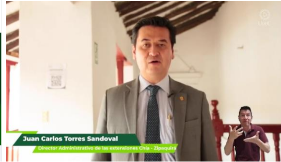
Imagen No. 9 “Publicación información Foro Translocal Extensión Chía- Zipaquirá”:

https://www.facebook.com/ucundinamarcaoficial/posts/pfbid0P7Zxzf51sNR4fusX7Rssi2bTnxEP882odGtAEiWTTthe7oeotADRK7PeWxpU1NI