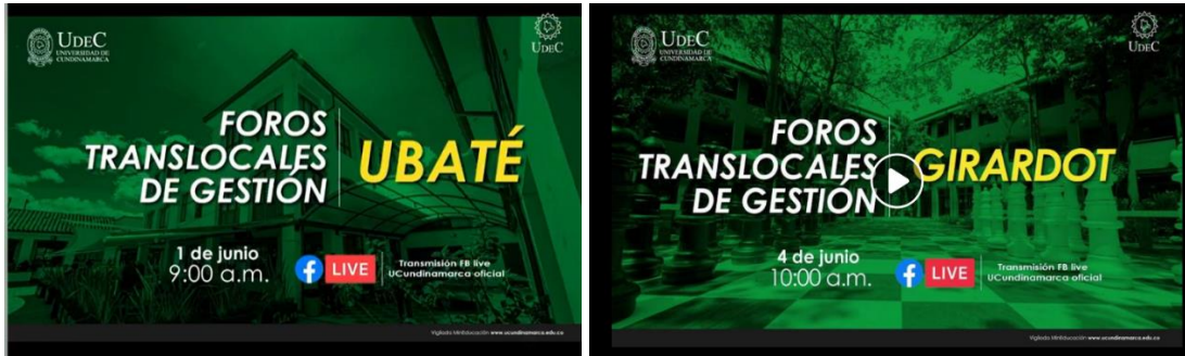
Imagen No. 12 “Foro Translocal Extensión Ubaté”:

https://www.facebook.com/ucundinamarcaoficial/videos/2709426196010159