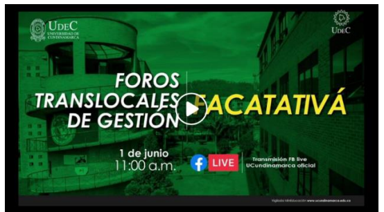
Imagen No. 11 “Foro Translocal Extensión Facatativá”:

https://www.facebook.com/ucundinamarcaoficial/videos/1911233019042331