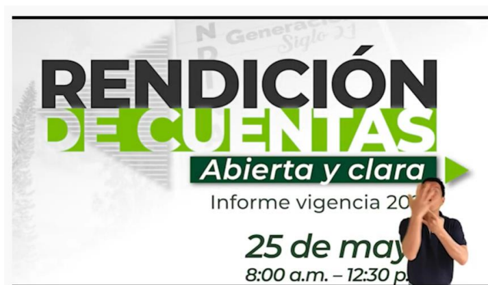
Imagen No. 6 y 7: https://www.youtube.com/channel/UChAmWg53w4HyIXmD26AExog

administrativos, emisión de cuñas en emisoras locales de Girardot y de Chía, boletín Interno y Publicación en Intranet, divulgación en Redes Sociales ( Facebook, Instagram y Twitter ), micrositio en la Página web sobre Rendición de Cuentas, publicación del comunicado No. 001 “ Plan de trabajo audiencia pública de rendición de cuentas de la vigencia 2020 ”, videos en el canal de YouTube Institucional, notas en la Agencia de Noticias de la Pagina web, boletín de Prensa y la publicación de banner en la Página Web de la Institución.