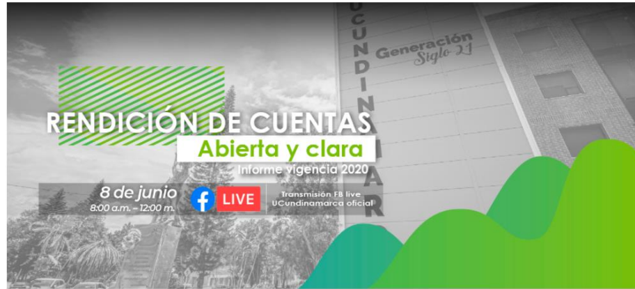
Imagen No. 1 https://www.ucundinamarca.edu.co/index.php/rendicion-de-cuentas