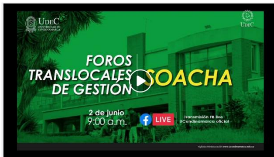
Imagen No. 8 “Foro Translocal Extensión Soacha”:

Se adelantaron durante los meses de mayo y junio del 2021, seis eventos de socialización y participación en el que cada director de seccional o extensión expusieron y dieron a conocer las actividades realizadas en su gestión durante la vigencia 2020, gestión en inversión, cumplimiento de programas planes y proyectos además de habilitar espacios de interacción con los asistentes, lo anterior se realizó mediante transmisión en vivo a través de la página oficial de Facebook de la Universidad de Cundinamarca, cada sesión contó con la participación de la Dirección de Control Interno a fin de realizar la evaluación del ejercicio.