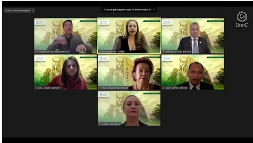
Rendición de Cuentas UCundinamarca - IPA 2021