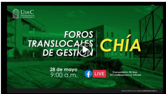
Imagen No. 10 “Foro Translocal Extensión Chía”:

https://www.facebook.com/ucundinamarcaoficial/videos/1847874995379744