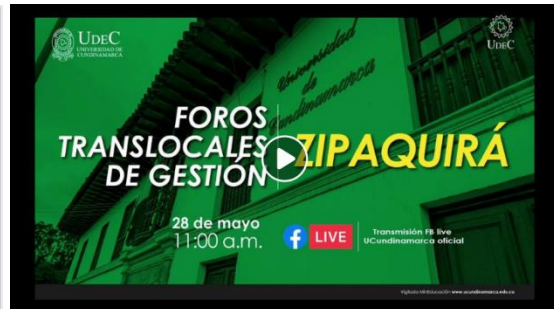
Imagen No. 9 “Foro Translocal Extensión Zipaquirá”:

https://www.facebook.com/ucundinamarcaoficial/videos/85310365562650